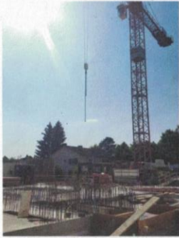
Baustelle Kirchgemeindehaus Wallisellen

Die reformierte Kirchgemeinde Wallisellen ist ein besonderer Ort. Hier werden besondere Geschichten erzählt, die Menschen auf der ganzen Welt mit Gott erlebt haben. Nicht das Gebäude macht den Ort einzigartig, sondern die lebendige Gemeinschaft, die hier